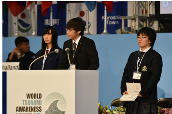
被災地からの報告