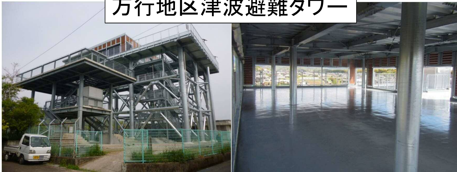
万行地区津波避難タワー

うち5地区については平成25年度までに整備済みとなっており、残り1地区についてもH28年度完成予定。