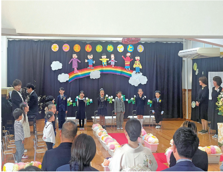
4月からは三浦小学校に通う6名の卒園式 (令和8年3月 南部保育所)

10名を切ったから直ちに保育所編成を行うという考えは持っていない。また、2歳児の受け入れもできる見込みである。保育所の再編成については、保護者や地域と共通認識のうえで、丁寧に時間をかけて行う。