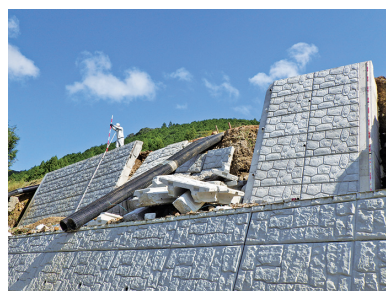
農業用施設(佐賀橘川地区)

●専決処分の承認を求めることについて(令和7年度黒潮町一般会計補正予算)専決2号 9月の台風15号で被災を受けた農業用施設1件及び公共土木施設1件の災害復旧のための測量設計委託料及び復旧工事費の専決処分。