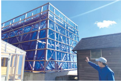
施設整備が進む採かん施設

●令和4年度 一般会計補正予算 肥料高騰に 町独自支援 ■小規模農業者支援事業費補助金 49万円 農業収入50万円未満の農業者に肥料購入費の20%を補助するもの。