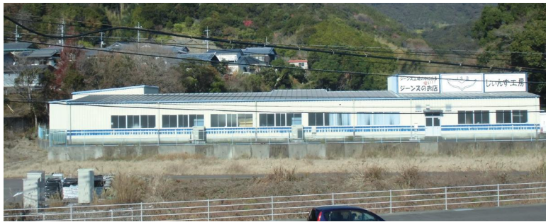
ジーンズ工房大方