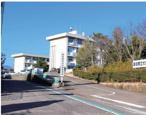
学生寮を計画中の大方高校（入野）

令和5年4月統一地方選挙の告示板等の事前発注処理業務のため、補正計上し、繰越すもの。