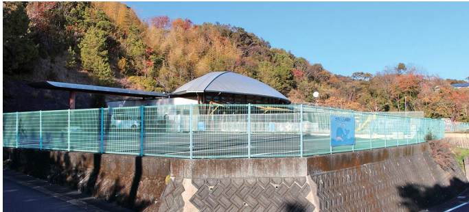
くじら保育所（上川口）

本委員会に付託された9議案は、審査の結果、全会一致で可決すべきものとなった。 また、陳情は「子どものために保育士配置基準の引き上げによる保育士増員を求める意見書の提出を求めるもの」で審議の結果、全会一致で採択した。