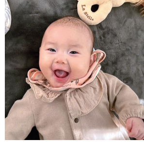
伴走型支援を受けながら すくすく育つ乳児

食材料の高騰分を計算すると、1食当たり297円の賄材料費が必要となる。小学校の児童一人当たり260円、中学校生徒は290円をいた、だいているため、その差額分、小学生は37円分、中学生は7円分を1年分の食数に換算して計上した。