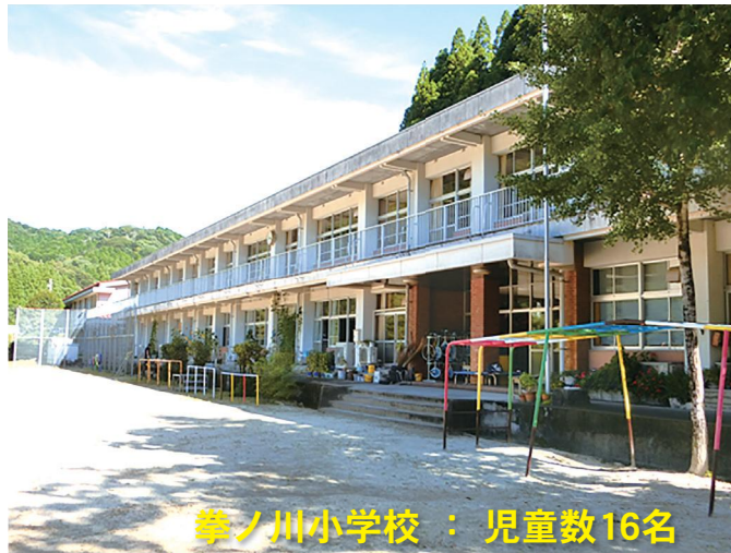
拳ノ川小学校：児童数16名

明治8年 拳ノ川小学校創立 昭和48年 学校創立百年祭、プール落成 昭和56年 校舎改築、体育館落成 平成24年 県コミュニティスクール 令和2年 県実践的防災教育推進事業 指定校