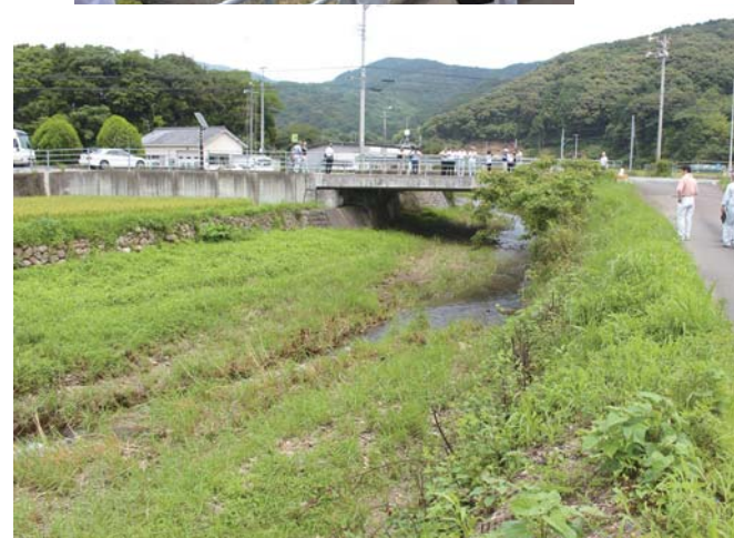
上 2 枚は伊田川河川堆積物の除去を(伊田郷)