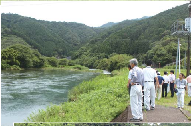
▶伊与木川の堆積土砂の撤去を (藤縄)