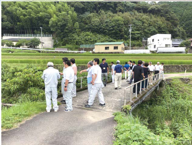
右は、衣川の堆積物の取り除きを。 下は、視察終了後の挨拶の一コマ (共に川奥)