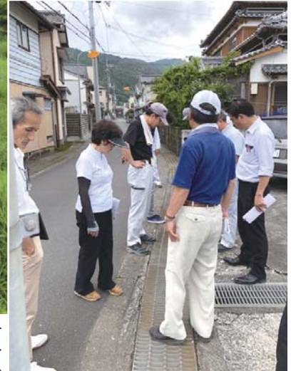
▲伊与木川排水ゲート 付近の土砂撤去を (上分)