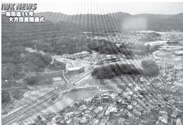
IWK NEWS 一輪国道66号 大方改良開通式

委員からどのように判 断するか、また、この条例 によって職員が萎縮をす るのではないかと質問があ りました。執行部は、人事 評価を導入しており、職 員の定期評価が最下位の 場合であれば、その対応 は必要だとのことでした。