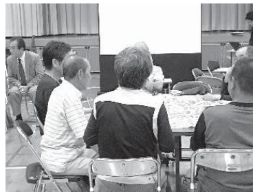
土砂防災のワークショップ (かきせ地区)