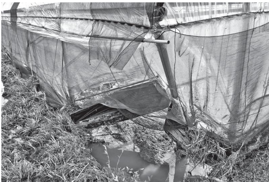
台風16号により被災したビニールハウス