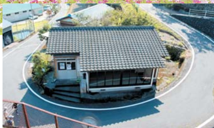
▲ヘアピンカーブ脇に建つ集会所