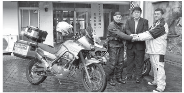
前回の訓練の一コマ (H27年7月19日)