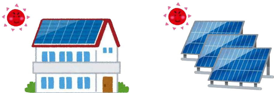
太陽光発電設備設置

再エネで賄うためには、例えば「 太陽光発電設備設置 」や「 再エネ電気契約 」によって自宅で再エネを利用することで補助要件を満たすことができます。