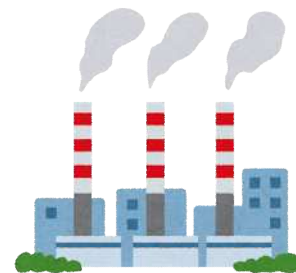
一般的な電気契約