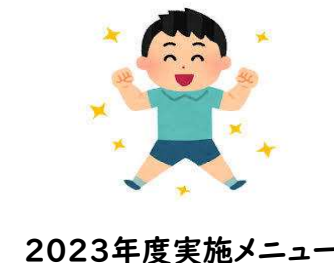
2023年度実施メニュー

みなさんへお願いです！ 給食センターでは、異物混入や食中毒を発生させないために、衛生に気をつけて調理をしています。ですが、私たちの力だけでは完全に防ぐことはできません。給食当番さんや当番以外の方も、身じたくなど衛生に気をつけることが大切です。みなさんも給食を作る一人です。ぜひ一緒に、安心安全な給食作りを行っていきましょう。