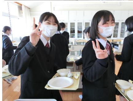
令和3年度 佐賀中学校 バイキング給食