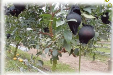
ストッキングをかぶせる