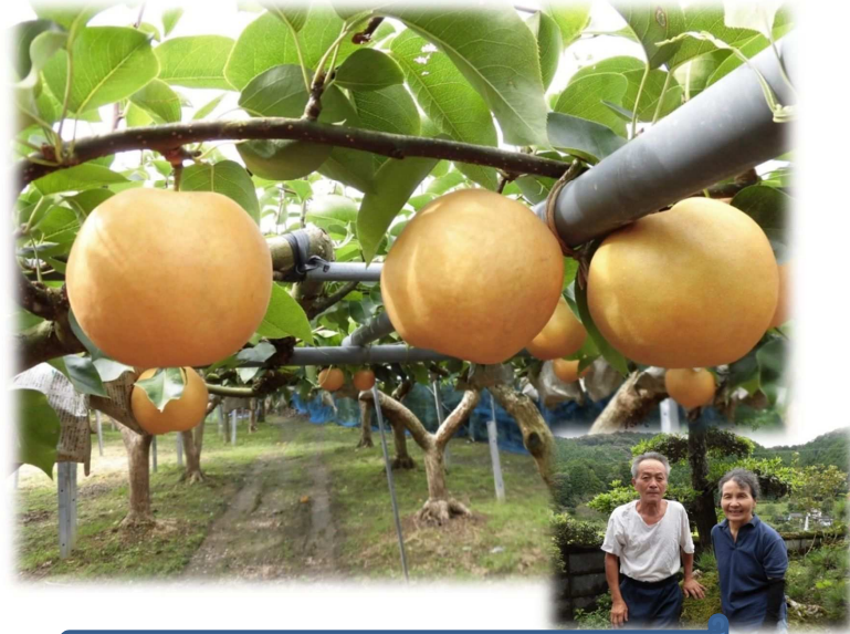
小谷果樹園さん：黒潮町佐賀橋川