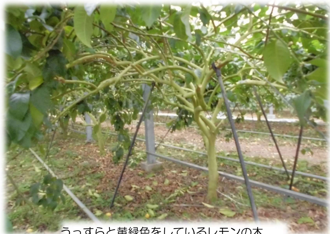
うっすらと黄緑色をしているレモンの木