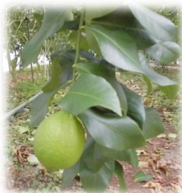
木に成っているレモン