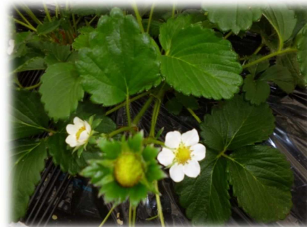
いちごの花とまだ未熟ないちごの実