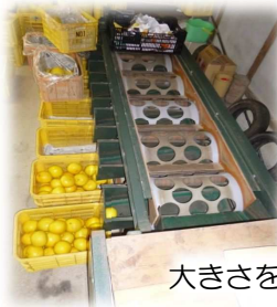
大きさを選別する機械

文旦のお世話で大変な事は草刈りで、収穫するまでに5～6回は草を刈らなくてはいけない、と話されていました。