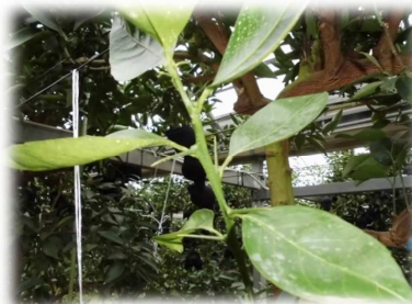
長くするどいトゲ

一生懸命やると、あとから結果がついてくる。ものづくりには楽しさがある。結果がある。