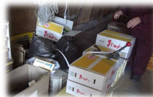
選別と荷造り作業

ポンカンに限らず農作物は日ごろの管理が必要です。種をまいても木を植えてもお世話をしなければおいしく育ちません。ポンカンをおいしく育てるためには、草刈りや剪定、消毒など毎日の木の管理がとても重要です。また、自然が相手なので天候に左右されやすく、せつかくたわわに実っても収穫までに雪が降りポンカンに積もってしまうようなことになればすべて台無しになってしまうそうです。収穫時期も天候と相談しながら決めているそうです。