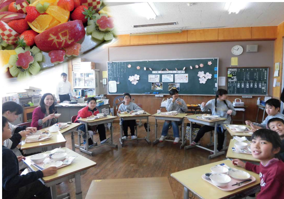
平成30年度 6年時 南郷小フルーツバ 作ク ①