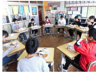
平成30年度 6年時 南郷小グループ 作中 ③