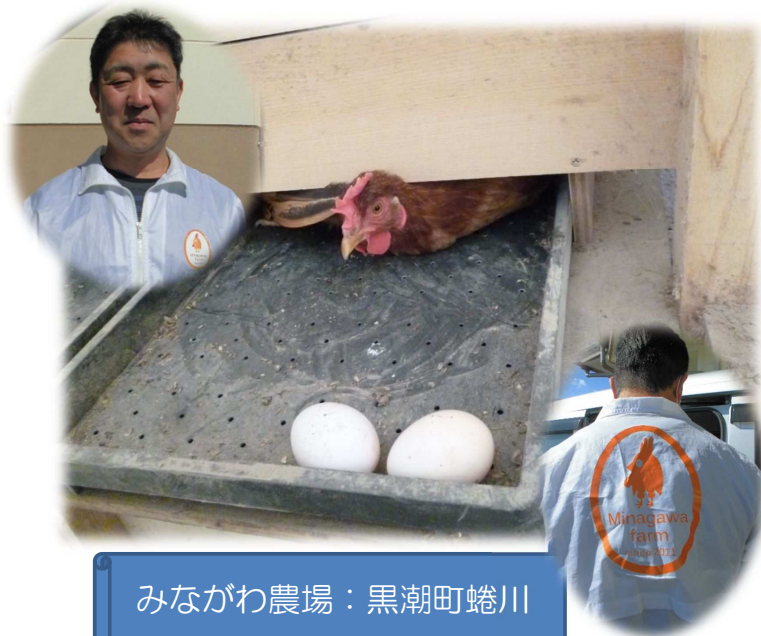
みながわ農場：黒潮町蜷川