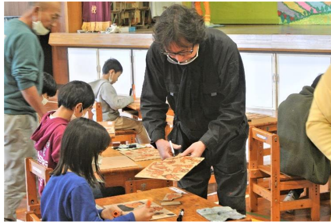
みんなのヘンテコをちょきちょき…