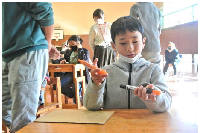
2色をうまく使えると、うまく描けるようになるそうです☆