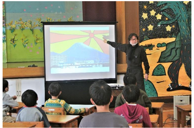
富士山の近くに住んでいます