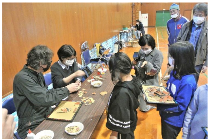
一人ひとりと話しながら… 楽しかったですね！