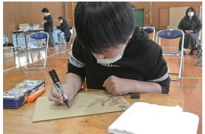
好きな車も描こう！