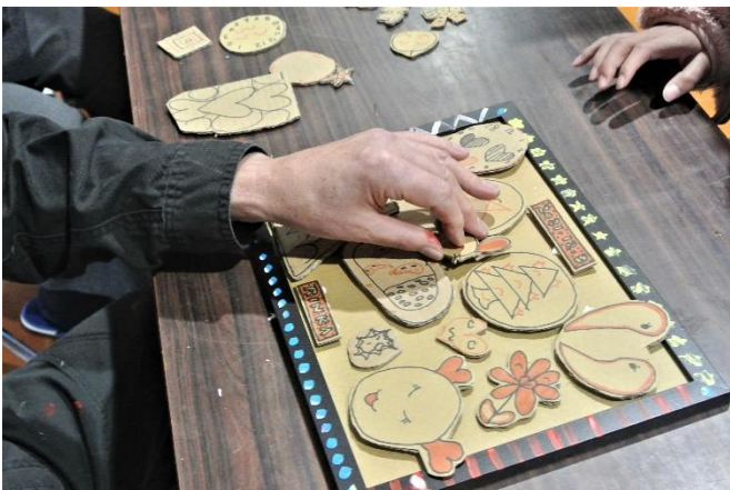
ものすごいスピードで、どんどん傑作に☆