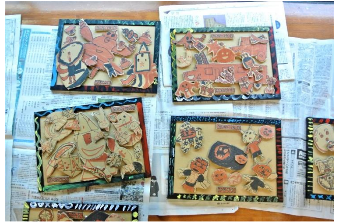
切ってはると、重ねられたり影ができたり。少し工夫するだけでもっとステキになるよ！と教えてくれました