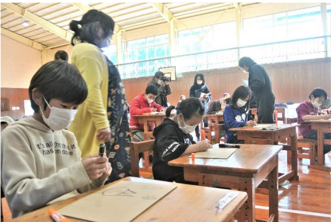
最初はちょっと迷いながら…