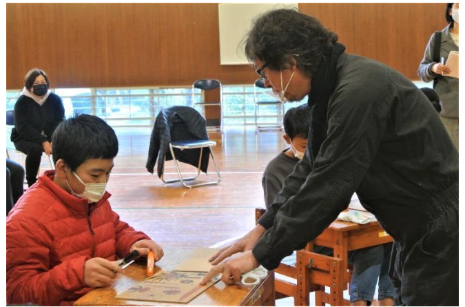
これはなに？ へ～おもしろいね！