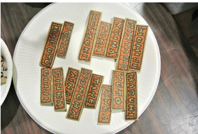
「作・絵 宮西達也」の字のような、みんなの名札☆