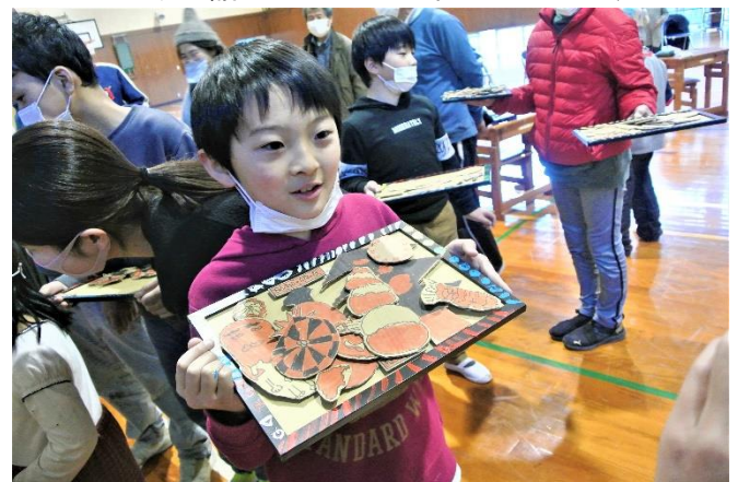
作品をもつみんなは、誇らしげ！