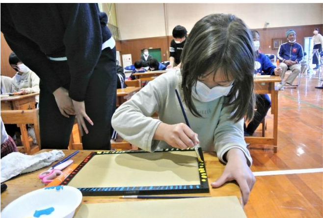
みんな、それぞれいいね！