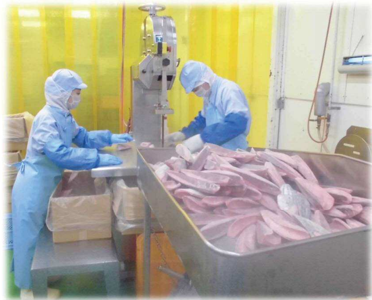
明神水産：黒潮町佐賀

佐賀地域にある工場で、魚の加工・販売をされています。全国的には小規模の会社であり、生産の8割は戻りカツオをとり扱うことで、大きな会社との差別化をはかられているそうです。幡多地域の一部スーパー、生協、ギフト販売をされています。