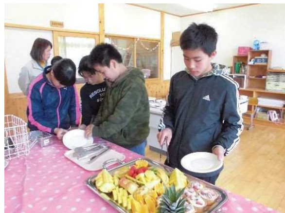
平成30年度 6年時 三浦小フルツバ 侍ツグ ②