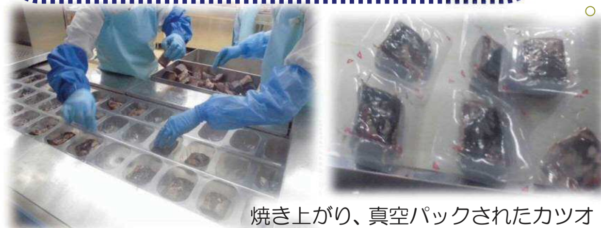
焼き上がり、真空パックされたカツオ

カツオのたたきを作る際に、他社では炭焼きが主流な中、明神水産でこだわっているのは「ワラ焼き」。ワラで焼くことで、臭みがとれて燻製のような風味がつくのだそうです。焼きの作業は3段のベルトコンベアを使い、1段目にカツオ、2段目にわらをしきつめます。カツオを冷凍のまま表面だけ焼くので、内部の鮮度は保持できるということでした。ワラにもこだわっていて、自社栽培のワラと高知県産のワラを使用し、1年間でだいたい25000束を消費するそうです。