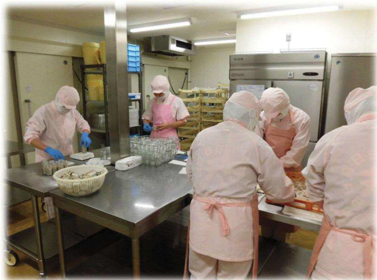
土佐佐賀産直：黒潮町佐賀