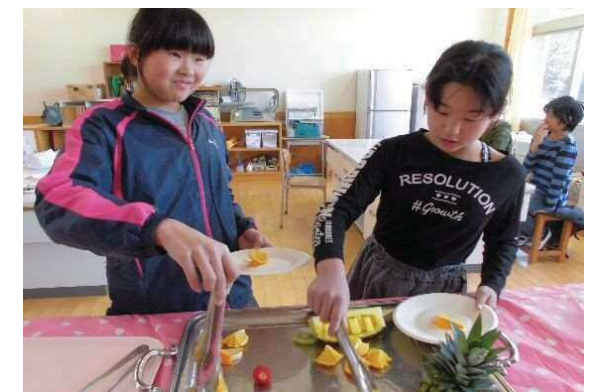
平成30年度 6年時 三浦小フルツバ 侍ツグ ③