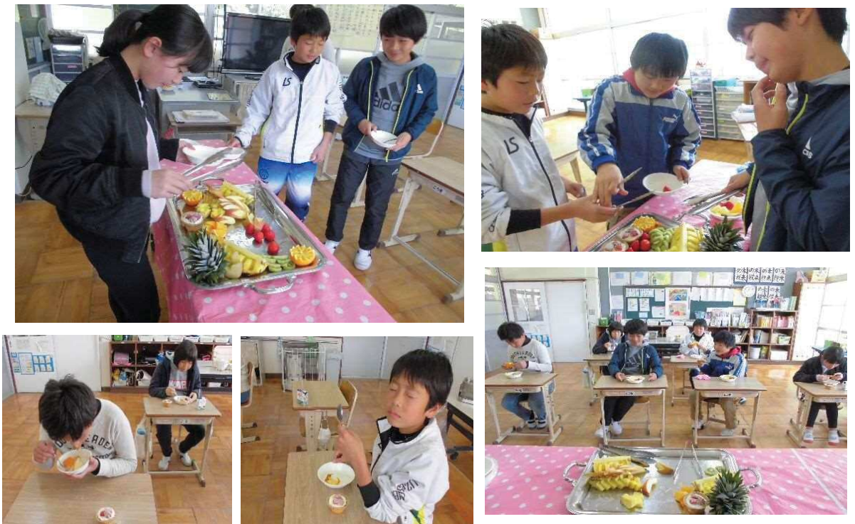
平成30年度 6年時 田ノ口小グループ 作り②

～「サバ」について～ サバの脂肪にはDHAやEPAが青魚のなかでも多く含まれています。DHAは脳や神経と深く関わり、記憶を高めると言われています。EPAは血液中の中性脂肪やコレステロールを低下させるので、血液をサラサラにしてくれます。