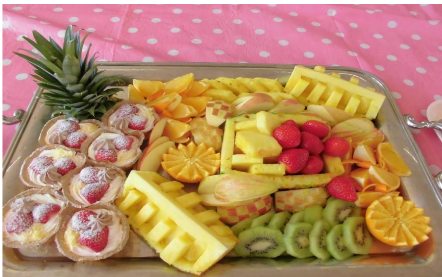
平成30年度 6年時 三浦小フル-ツァ 什ツァ ①