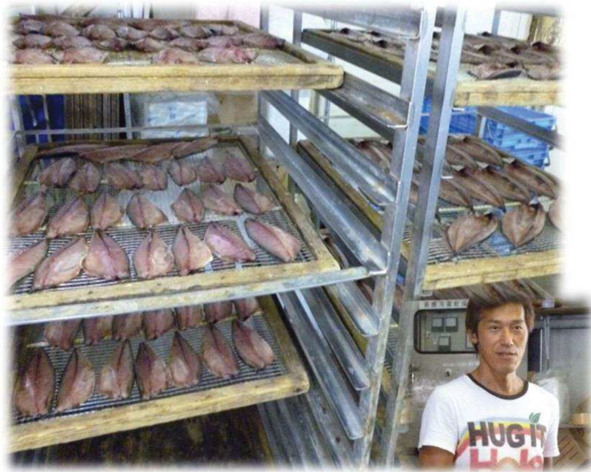
マルア海産：黒潮町田野浦

田野浦地区にあるマルア海産さんでは、アジやサバ、しらすなど魚の干物を製造されています。