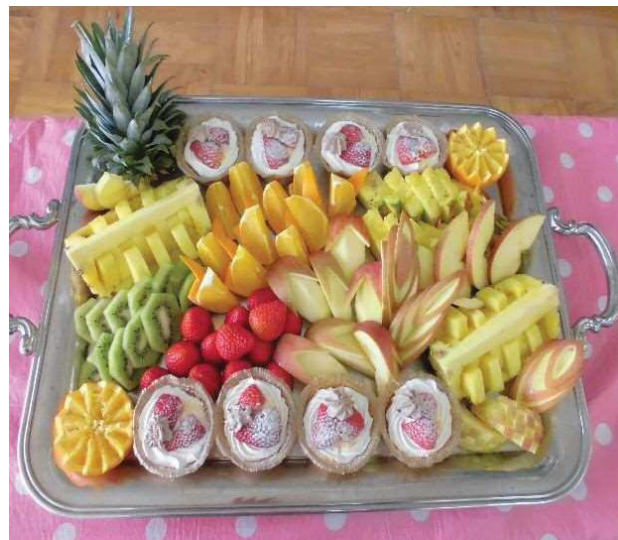
平成30年度 6年時 田ノ口小グループ 作り①