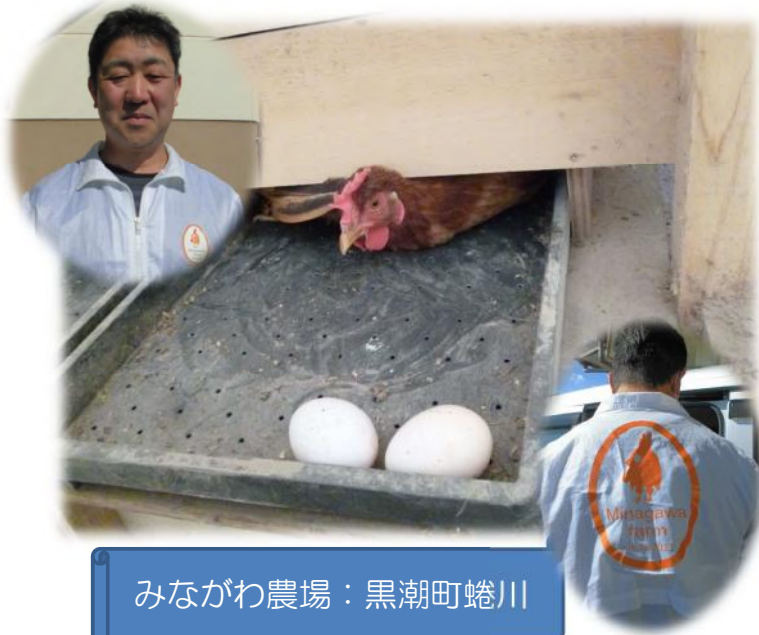
みながわ農場：黒潮町蜷川