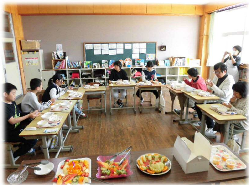
平成29年度 6年時 南郷小フルーツバ`仲間 ①