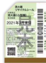
既販品用シール(見本)