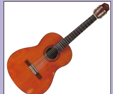
ミニクラシックギター