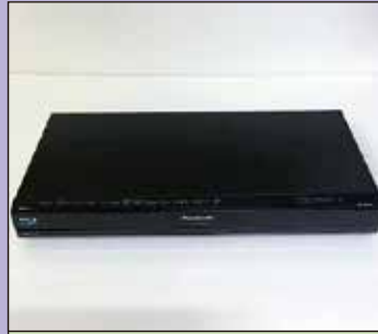
パナソニックブルーレイレコーダー