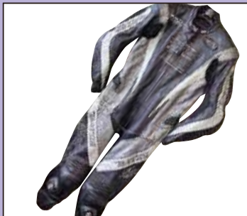
ライダーズジャケット