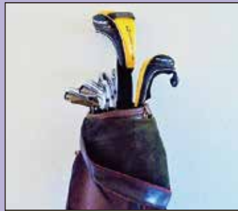
ゴルフクラブ一式