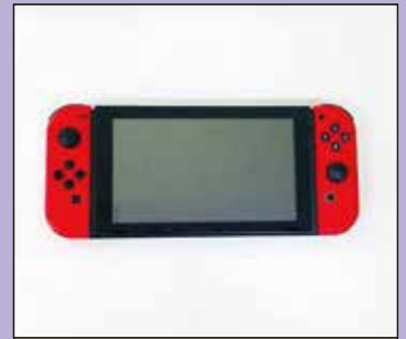
ニンテンドースイッチ