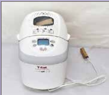
ホームベーカリー