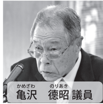
かめざわ のりあき 議員 亀沢 徳昭