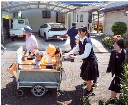
訓練を行う子どもたち