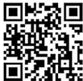
海上保安官紹介動画