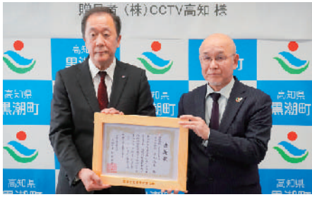
中山社長(左)と松本町長(右)

中山社長(左)と松本町長(右)も、少しでも良い環境で過ごすように活用してもらえれば」と話しました。