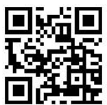
マイナポータルホームページ

※子育てや介護をはじめとする行政手続きの検索やオンライン申請がワンストップでできたり、行政からのお知らせを受け取ることができる自分専用のサイト。