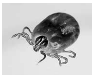
フタトゲチマダニ

SFTSウイルスを保有するマダニ類に咬まれることによって感染し、発症するウイルス性感染症です。