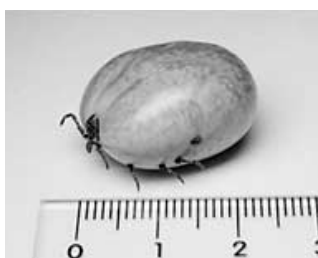
タカサゴキララマダニ