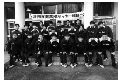
清明学院高校サッカー部の皆さん

集落活動センターかきせでは、昨年12月～今年1月にかけて、2チーム延べ69名の宿泊受入れを行いました。大阪府の高等学校サッカー部からは食事が大変好評で、お礼状もいただきました。また、愛媛県の中学生サッカーチームもご宿泊いただきました。調理スタッフを始め地域の皆さんの協力のおかげです。今後も宿泊者に喜んでいただけるように頑張りたいと思います。