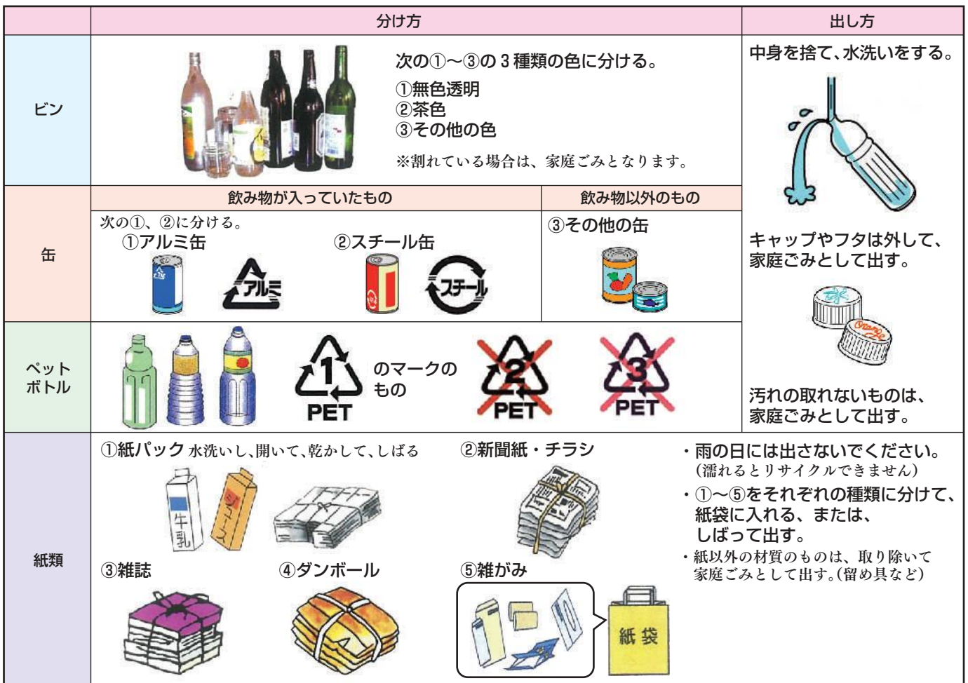
表 資源ごみの分け方・出し方について

分別されていないと、幡多クリーンセンターの作業員が直接手作業で分別しなければならず、新型コロナウイルス感染症などへの感染リスクが非常に高くなりますので、ご協力をお願いします。