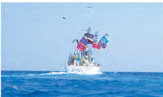
今シーズンのスタートを切った第83佐賀明神丸

今シーズンのカツオ一本釣り漁の開始に向け、2月、佐賀漁港から続々とカツオ船が出港していき、出港の際には、船員の家族や友人、町民などが見送りに駆けつけました。