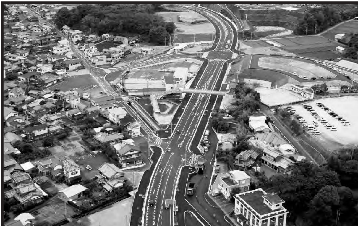
(H31.3.24全線開通した大方改良道路)