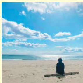
2021年2月10日インスタグラム掲載