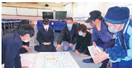
HUGを行う生徒と住民ら

参加者らは、備蓄品の確認やテントの設置方法の確認などをした後、「HUG(避難所運営ゲーム)」を行い、避難者を受け入れる際にどのように部屋割をするかなどを話し合いました。