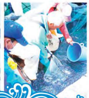
活餌を船へ積み込み