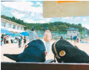
上川口マルシェに出品した作品

A 11月に開催された「上川口マルシェ」には、手芸品などを制作し出展しました。せっかくなので「黒潮町らしさ」を出してみたいと思い、カツオの刺繍を施したり、上川口地区の「くじら公園」からくじらをモチーフにしたポーチを作ったりしました。作品に使用した布は、じいんず工房のジーンズの端切れを用いるなど、町内のものを使ったこともこだわりです。また、コロナ禍の状況もあり、最近は散歩をしながら体を動かしています。片道30分以上歩くこともあり、のんびり海を眺めて歩いたりすることが楽しいです。