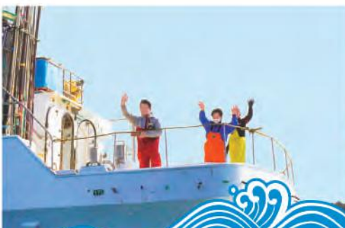
手を振る明神漁労長(左)と船員ら