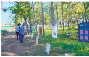
作品を観る来場者ら