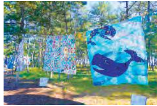
風になびくキルト作品

今年のテーマは「布を楽しむ」。クッション、小キルト、大キルトの3部門へ計81点の応募があり、来場者は出店やワークショップ、琴の演奏などを楽しみながら作品を満喫していました。