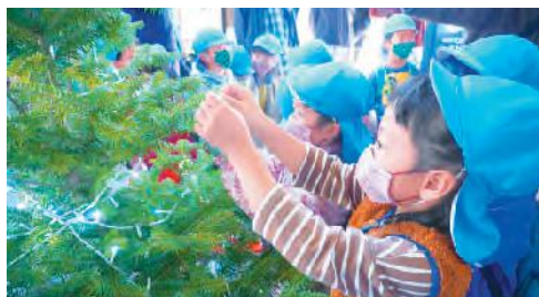
飾りつけをする園児ら

園児らは、海の王迎駅からクリスマス仕様になった列車で土佐入野駅まで来た後、クリスマスツリーへオーナメントなどの飾りつけを行いました。その後、クリスマス