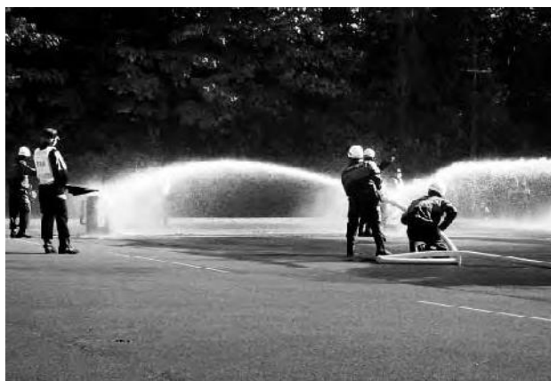
注水競技を行う団員ら

この素晴らしい結果は、日頃の訓練の成果、また団員の皆さんとそれを支える方々の力の賜です。普段からいざという時に備えて訓練をおこなっている消防団員の皆さん。地域にとって、そして黒潮町にとっても頼もしい存在となっています。