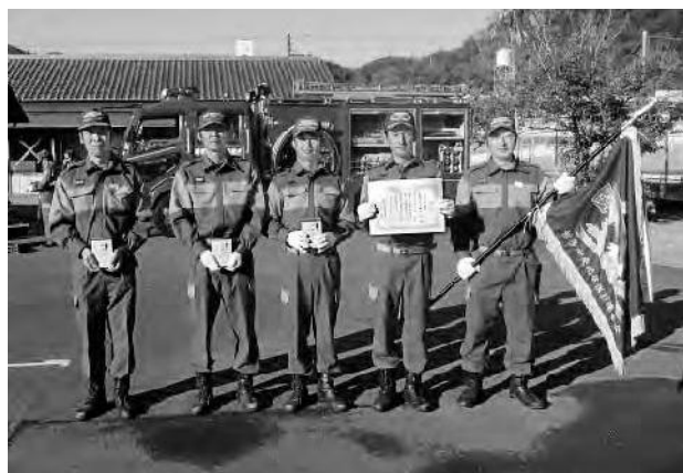
小型ポンプの部で優勝した蜷川分団