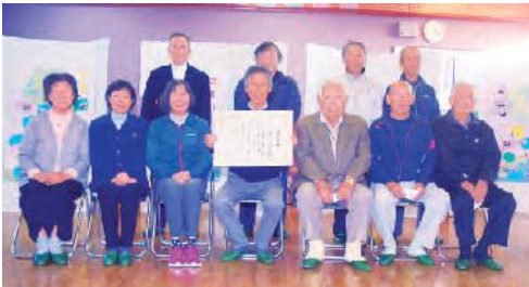
「見守り隊」の皆さん

交通量の多い交差点には、指定日以外にも率先して通学路に立ち見守り隊の皆さんの温かいまなざしと行動が危機の早期発見・予防となり、児童の安心感にもつながっています。