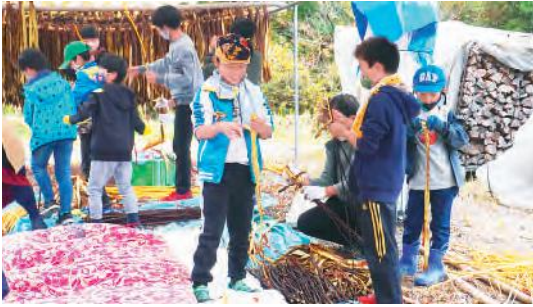
楽しそうに体験する児童ら

参加した児童は「最初は難しかったけど、綺麗に剥げるように頑張って嬉しかった」など感想を話しました。