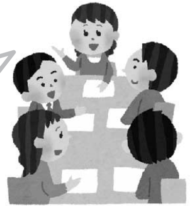
審査会での話し合い