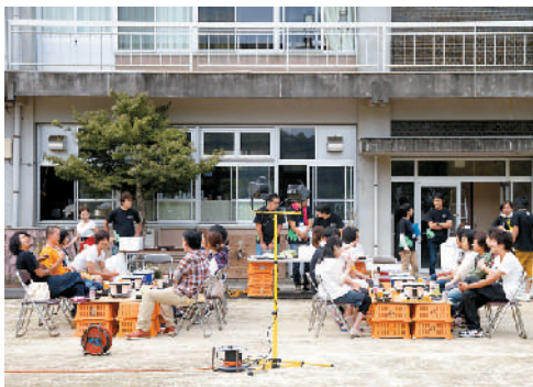
町内外から独身男女23人が参加。体験イベントなどを通じて交流しました。

町内人口の増加を目指し、独身男女の出会いの場を提供するとともに、参加者に黒潮町の魅力を肌で感じてもらえるようにと、黒潮若手の会が企画。町内外から23人の男女が参加し、そば打ち体験やパークゴルフ、バーベキューなどを楽しみました。参加者たちは、協力してイベントに取り組むうちに次第に打ち解け、過去最高となる5組のカップルが誕生しました。 黒潮若手の会では、新たな町の魅力の発信地となるよう、今後さまざまなイベントを企画していきます。 (黒潮若手の会)