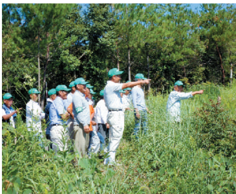
そろいの緑色のキャップをかぶり、農地をパトロールする農業委員たち。

農業委員会では、調査結果を踏まえ、遊休農地所有者に「意向調査」を実施し、相談やあつせん、有効活用などに取り組み、解消につなげていく計画です。 (農業委員会)