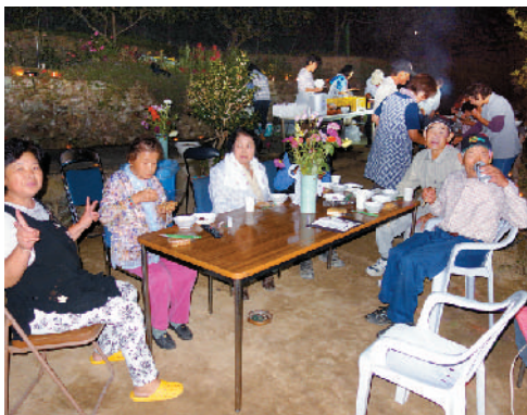
会場にはカラオケも用意。キャンドルの灯りを見ながら、楽しい時間を過ごしました。

午後6時ごろから、あつたか利用者や、近隣住民ら10数名が集まり、バーベキューと手づくりの料理で会食。日没後は、キャンドルの灯りを楽しみました。