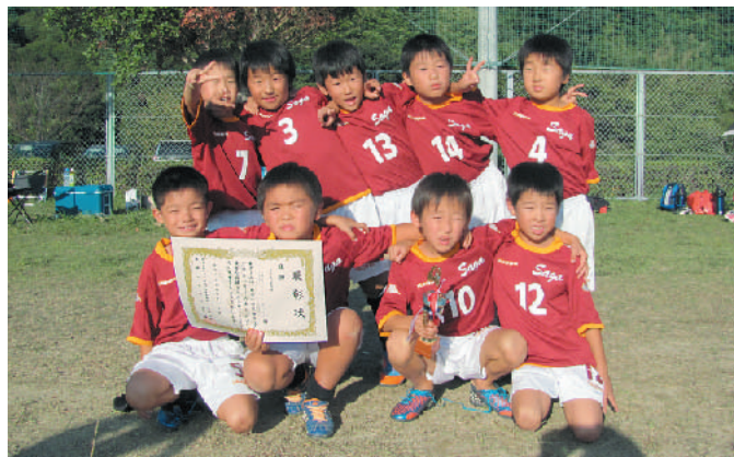
2年生以下の部で優勝した佐賀少年サッカークラブ。