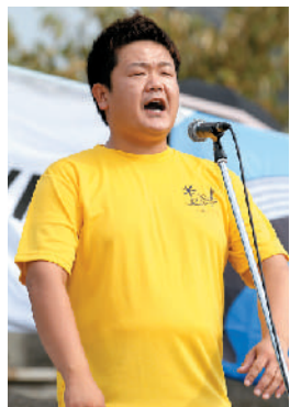
開会式では、「舟歌」でレースの安全と大会の成功を祈願。

ラソンに向かうジュニアや中学生の子どもたち。鍛え抜かれた体で1.5キロのスイムと10キロもの過酷なマラソンコースに挑む一般選手たち。暑い中、観客やスタッフの声援を受けながらレースに臨んだ選手たちは、ゴール後、達成感に満ちた表情を見せていました。 競技以外でのお楽しみ、前夜祭の「ふれあいカットパーティー」には、選手や関係者約1000人が参加。毎年参加している選手や初めて来た方など、アスリート同士や地域の人たちとの楽しい交流が生まれていました。 今大会が無事開催できたのは、協賛いただいた関係団体や、ボランティアスタッフ、地域の皆さんのおかげです。本当にありがとうございました。