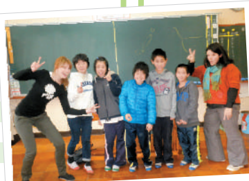
2012年2月 伊与喜小学校にて