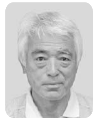
松並 作 ☎43-3606 浜の宮・町・万行