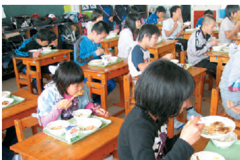
佐賀のカツオが一番おいしい!との声も。