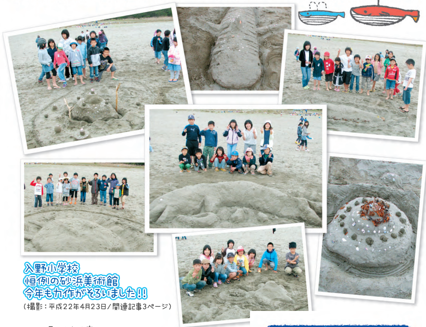
入野小学校 恒例の砂浜美術館 今年も力作がぞろいました!!