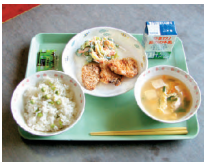
中央のお皿が鰹カツです。

「カツオめしやカツオの角者は人気メニューのひとつですが、カツオは気に入ってくれるか、反応が楽しみ」と給食センターの職員は試食に余念がありません。