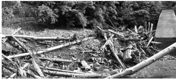
平成20年6月29日豪雨による土石流発生（安田町荒田川）幸い、砂防堰堤により下流に被害はでませんでした。

害警戒情報が発表されていない場合でも、雨の状況や周辺の状況を確認し、土砂災害発生の危険性を感じた場合は、速やかに避難してください。