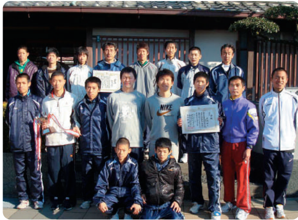
黒潮町駅伝チームのみなさん、おつかれさまでした!!今後のご活躍にも、大いに期待しています。