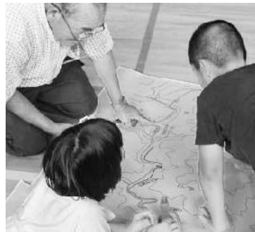
地域安全マップ作り