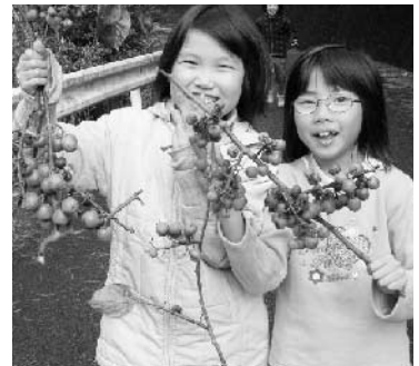
自然体験「かずらなし」採り