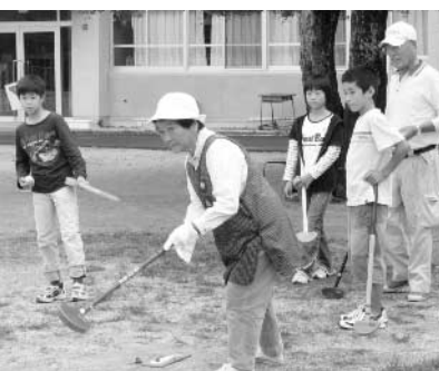
蜷川地区老人クラブの皆さんとの交流

この事業では「故郷の良さを実感し、故郷を愛する心情を育てる」ことや「豊かな社会性と人間性を育成する」ことを目標として、生産活動や奉仕活動、そして地域の方々と交流を継続的に進めています。