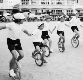
みんなで力を合わせた一輪車