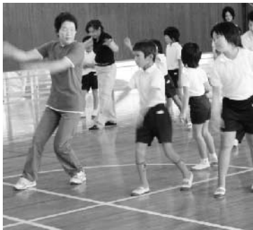
伝統文化「そばまき踊り」復活

れたものです。実際には、年度の始めに、地域住民・保護者・学校関係者などで組織する「学校運営協議会」において、本年度の教育目標および学校経営計画・教育課程の編成・組織編成に関すること・学校予算などについて学校長が提起する基本方針に基づいて、それぞれの立場での意見を出し合い、審議し、承認を得て、その年度の学校運営をスタートさせる仕組みになっています。さらに、地域住民・保護者が計画の段階から教育活動に参画し、地域の人材発掘や教材化など拳ノ川ならではの豊かな教育活動の創造を目指してテーマごとに3つのコミュニティ委員会を組織し、年間を通して活動を行っています。