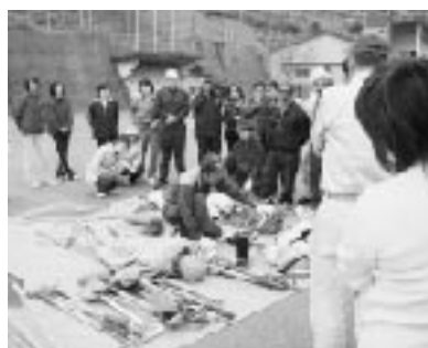
普段は見慣れない救助用の道具の説明を受けています。

また、日頃は交流のないメンバーが同じバスに乗り、訓練に参加してきたことで、新たな親交がうまれたことは、今後の黒潮町を考える上で大きな副産物ではないでしょうか。