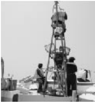
ホエールウォッチングの様子

生徒は明るく活発で運動会や文化祭などの行事においては学年がまとまりをみせ、地域や保護者からの素晴らしい評価を得ることができていますが、学校での生活面や学習面での課題があり、校内研や指定研究を通して取り組みを進めています。その一端を紹介させていただきます。