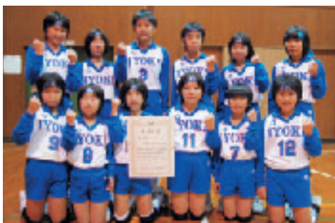
毎週水・木・土曜日に練習していますのでいつでも遊びにきてください。