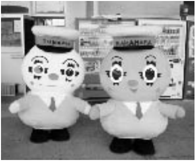
サニーくんとサンコちゃんです。