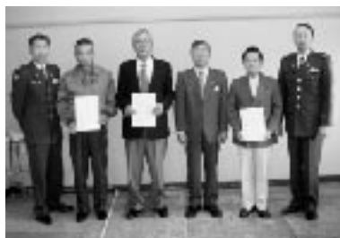
自衛官を志している方 お気軽にご連絡ください。

自衛官募集相談員とは、自衛官を志す方に関する情報の提供、地方協力本部の行う募集のための一般的・個別的広報に対する援助を、当該個人の好意に基づいて実施していただいている方々で、自衛隊高知地方協力本部長と黒潮町長の連名で四名の方を委嘱しています。