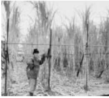
成長したサトウキビは、大人の背丈の倍以上にもなります。

質が良いサトウキビからは、おいしい黒砂糖が出来上がる。 「糖度の高いサトウキビを栽培するためには、土壌が一番大事、それから肥料の量と仕方。与え過ぎは大きく成長しても、いい味にはならない。」