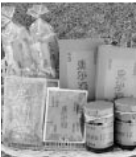
一度、味わってみてください。