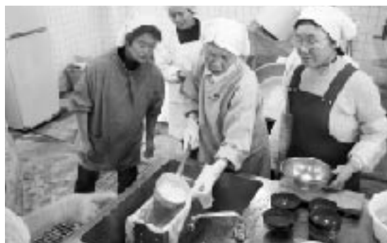
加持地区で採れた大豆で豆腐を作りました。

れの調味料を使用したラッキョウの漬物やケーキなどを口にし、味の違いを確かめました。「上白糖や精製塩の取り過ぎや食品添加物が引き起こすミネラルバランスの崩れが、体や心の病気を引き起こします。黒潮町にあるミネラルたっぷりの黒砂糖と天日塩、せっかくな地元の良い調味料があるのに家庭で生かさないもったいない。貴重な資源をもっと地元の人に取り入れて欲しい。」と、日常の食生活について考えさせられる講演内容でした。