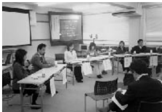
◇「おおがた学校」について

セミナーの最後にはインターネットを使って在宅ワークの実践者の方たちによる、地理的ハンディのある幡多地域において、IT機器を使った働き方の有意義性や今後の可能性、そのために必要な講座がインターネットなどで学べることの意義などについて活発な意見交換が行なわれました。