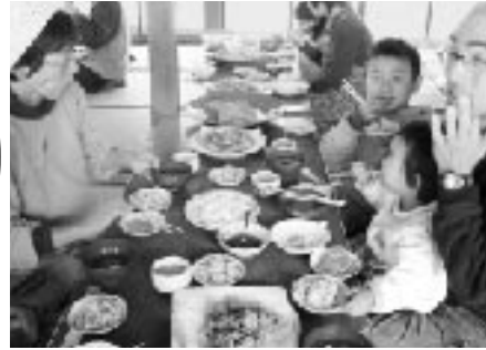
みんな食べる昼食は、作りたてのコンニャクと、黒潮町の郷土料理。会話が弾みます。