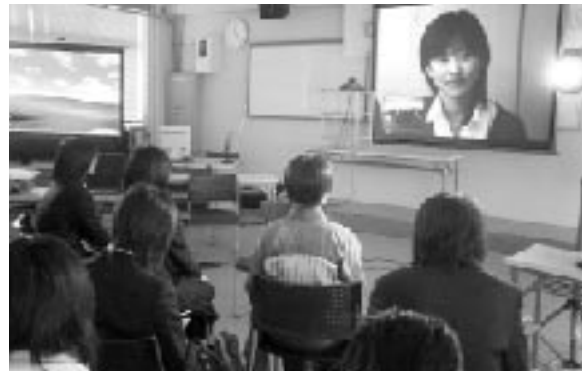
当日は、「おおがた学校」

去る十二月二日には、この「おおがた学校」の紹介と、その成果などについて皆さんに報告するためのセミナーが開催されました。(同実行委員会や黒潮町が主催)