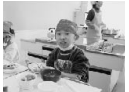
11月29日、南郷小学校1年生とのだいこん交流。この日は「大根菜めし」、「風呂吹き大根」、「大根サラダ」、「大根の入った味噌汁」を作りました。食育推進員や手伝いにきたお母さんたちのもと、みんな上手に包丁を使って野菜を切り、調理しました。