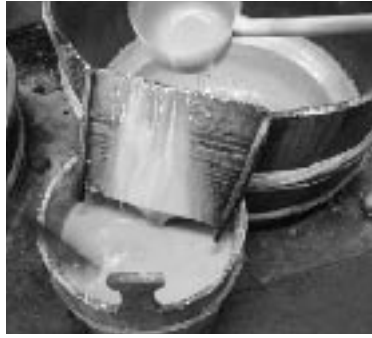
おいしい黒潮町の黒砂糖ができました。

このコーナーでは、私たちの町の特産物、そして、それを手がける生産者取材し皆さんに紹介しています。 今回注目した特産物は、大地方域で栽培されているサトウキビです。 サトウキビ、黒砂糖といえは沖繩が有名ですが、砂地が多い土壌と、海から吹きぬける風がサトウキビを栽培するのに最も適しているといわれ、その環境が整っている入野地区などで現在約四十戸の農家が栽培しています。 高知県内だけを見ると、黒潮町のサトウキビの生産量は最も多く、このサトウキビを加工して造る黒砂糖は黒潮町の特産品です。