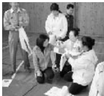
参加者には三角巾のお土産が！これで応急処置もバッチリ？

去る十一月十六日、いの町にある高知県消防学校で開催された「一日震災訓練」に、町内の女性消防隊（浜町・明神・会所・荷稻・川奥・鞭・伊田）から、十五人が参加してきました。