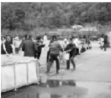
バケツリレーってやってみると、意外と難しい…

午前中は、南海地震の仕組みなどの講義を受けた後、応急処置訓練を受講し、午後からは屋外に出て、消火訓練や倒壊家屋からの救出訓練に取り組みました。