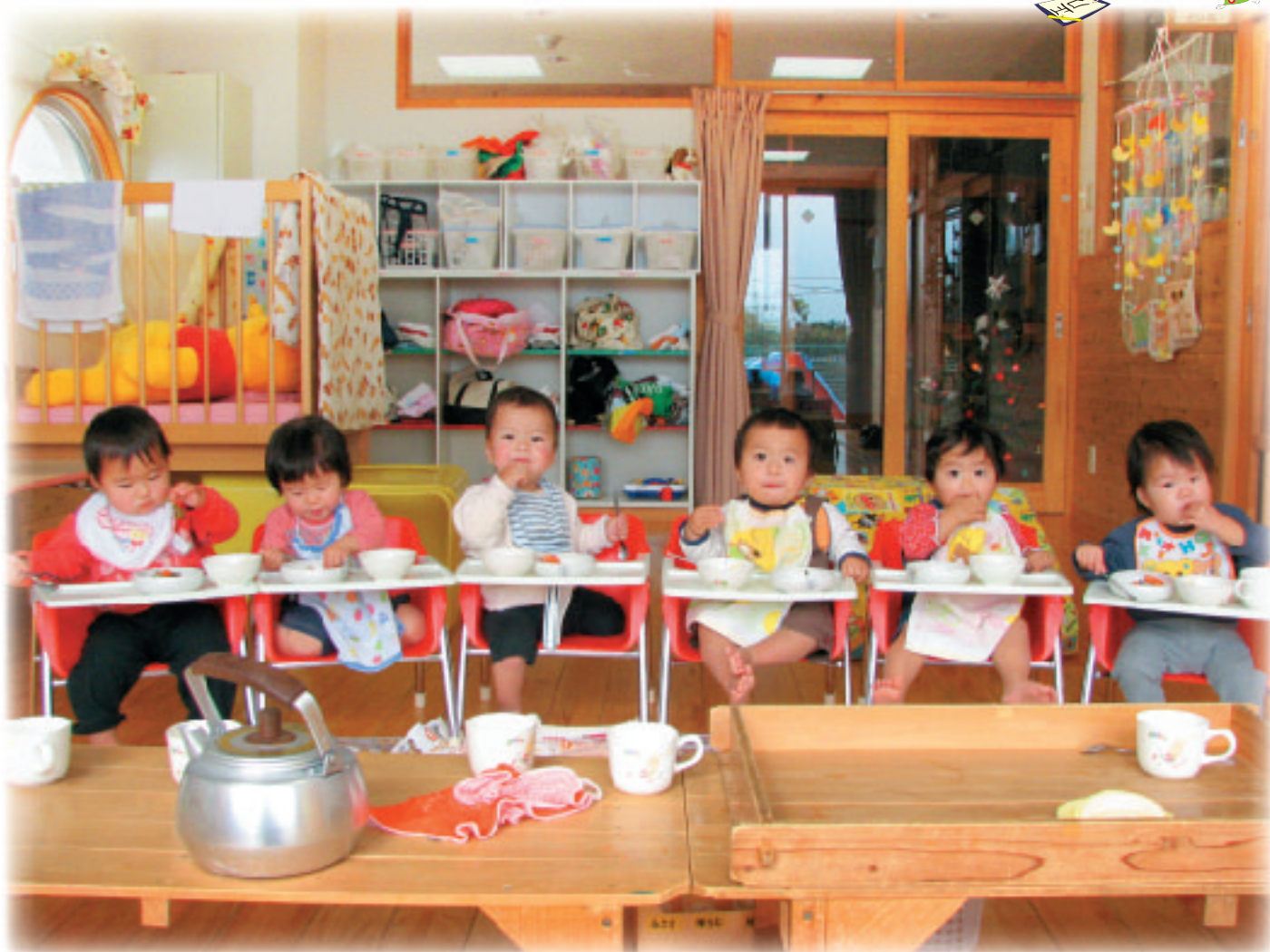
「お昼ごはん、おいしいな。」大方くじら保育所ひよこ組(0歳児)【撮影：平成18年12月20日】

子育て支援「いっしょに遊ぼう」「一時保育」を行っています。町内で子育てをしている方なら誰でもご利用できますので、お気軽にお問い合わせください。 大方くじら保育所 (☎43-1112)