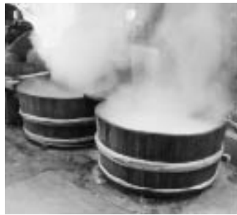
1番釜で不純物を取り除いた後、2番釜で水分を蒸発させ、3番釜で仕上げを行う。

黒砂糖は、収穫したサトウキビを压榨機にかけて搾り取った汁を煮詰めて造ります。 加工場には、毎年十一月中旬頃から、収穫したサトウキビが運ばれてきます。 一日に加工する約二千キの