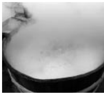
黒砂糖もほかもサトウキビの全成分がぎゅっと凝縮されて、栄養たっぷり！

色は黒砂糖と同じ褐色で、こちらもあっさりした後味のいい甘さ。お菓子づくりや料理の調味料として使用できますが、思ったより味が濃いので最初は味を見ながら調整するとおいしくできあがります。