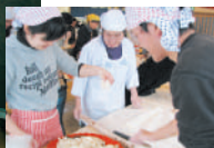
折りたんで細目に切り軽くほぐしたらできあがり!!