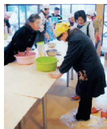
大きめのナイロン袋に入れて、次は粘りがでるまで足踏み。「おまん、体重が足りんみたいなので!」