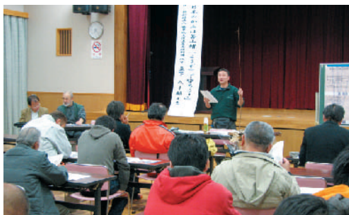
実際に若山(拳ノ川地区)に存在する野生化した楮を用いて説明がされました。

大切に保管されていたおかげで校章入りの卒業証書を作ることができました。 卒業証書にするかみと、お家の方からのメッセージを書いてもらうかみの制作も同時に進行され、事前に準備しておいた植物の葉や貝殻、ビーズなどを使って思い思いの飾り付けを施しました。