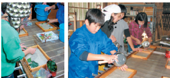
楮とトロロアイ（粘り気を出すために加えている植物）を漉き混ぜた水を枠の中へ流す作業は素手で行います。寒い中でしたが、世界にふたつとない自分だけの作品を作っているという気持ちが心にあるのでしょう。みんな最後まで本当に丁寧に制作していました。

大切に保管されていたおかげで校章入りの卒業証書を作ることができました。 卒業証書にするかみと、お家の方からのメッセージを書いてもらうかみの制作も同時に進行され、事前に準備しておいた植物の葉や貝殻、ビーズなどを使って思い思いの飾り付けを施しました。