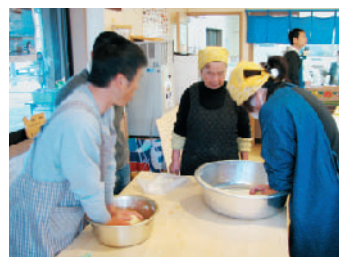
ざら目のない、なめらかな生地になるまでひたすらこね続けます。耳たぶくらいの柔らかさまで。「これ、意外と力いるね~。なかなか柔らかあならん」