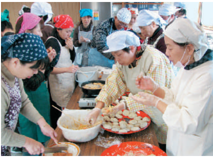
伊田びんび工房（加工場兼直売所） ☎44-1077 ㊟44-1078