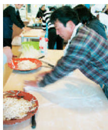
30分ほど生地をねかせたら、麺棒を使って薄く伸ばします。「伸ばしても縮む!?これがコシか!」