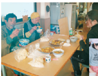
最後はみんなでおいしくいただきました!「お土産もたっぷり満足!疲れたけど楽しかった。またやりたいですね~」