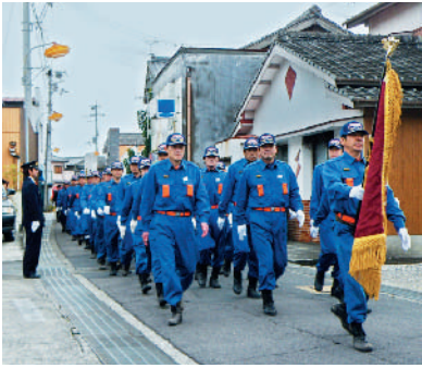
分列行進の様子（佐賀地区）