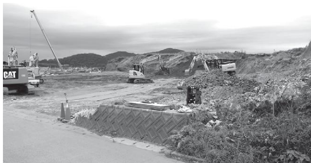
造成中の城山宅地を入野小学校西側から(10月5日)

内容は、県と同様に直接工事費の95%、共通仮設費の90%、現場管理の80%との基準を設けて算定している。実際、工事に際しては、業者の積算能力もあり、最低制限価格上限近くで落札をするということになっている。