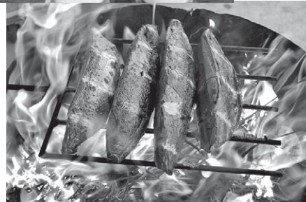
▲カツオのわら焼きタタキ