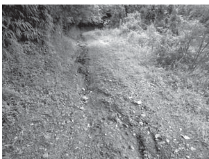
補修が必要な状況の林道の一例

■木造住宅耐震診断委託料 339万円 当初予定の100軒分が、5月、6月の申請受付分です