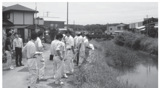
地区要望箇所の現地視察の一コマ

7月2日、議長と産業建設厚生常任委員全員で現地を見ながら高知県幡多土木事務所に要望をしました。