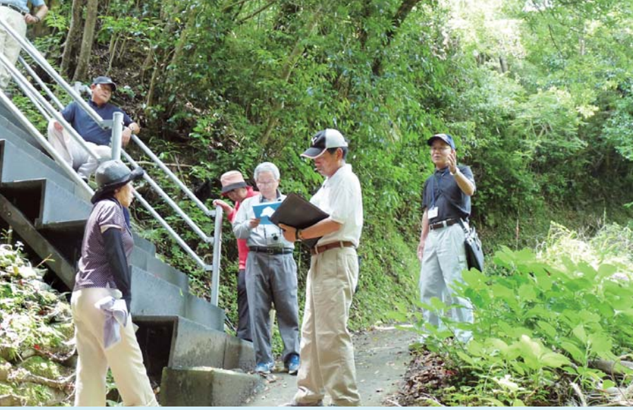
有井川の避難道にて説明をうける。

今議会の案件や地震津波対策の現状把握のため、平成27年6月12日、両常任委員会の日程を調整し、全議員で町内に完成している避難道、避難タワー設置予定地、工事中の金上野トンネル等の現地視察を行いました。