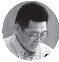
産業建設厚生常任委員長