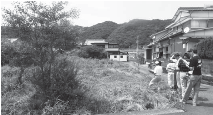
佐賀避難タワー予定地を視察しました（浜町地区）

集落活動センター北郷の米あめをポリ袋詰めにした場合の試作材料代等と、成分検査や保存期間確認を県技術センターへ依頼するものです。