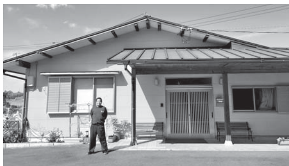
グループホームみうら(出口)