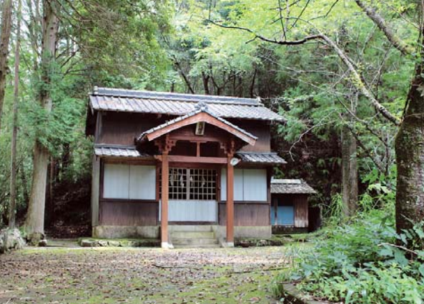
▲地域の守り神「正八幡宮」