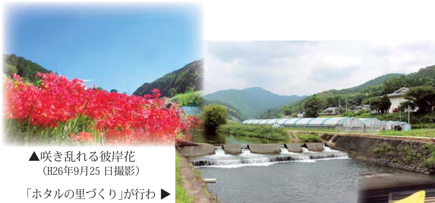
▲咲き乱れる彼岸花 (H26年9月25日撮影)