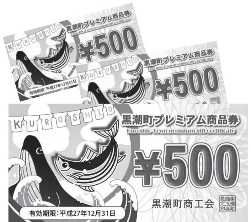
今年度発売するプレミアム商品券

会が昨年まで10%のプレミアム付きで発行してきた商品券へのプレミアム補助率拡大に対応する考えはあるか。