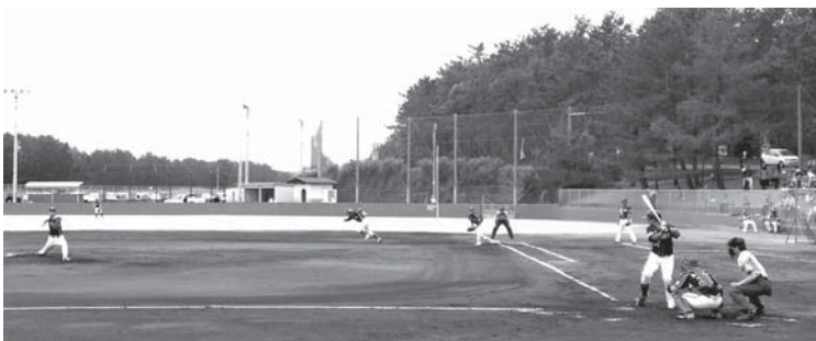
ファイティングドックス公式戦の様様