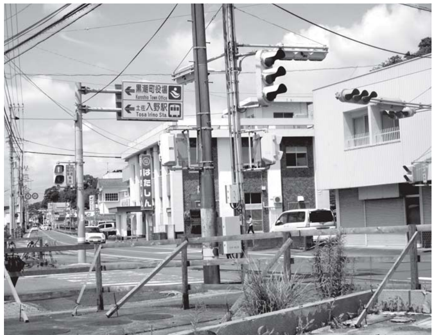
改良が進む国道56号（入野地区）

介護を必要とする方や、高齢者等への個別収集、地区外へのゴミ出しについては、今後の検討課題としていきたい。