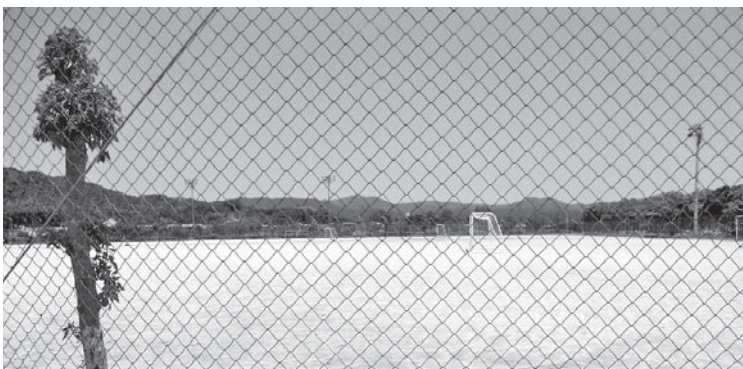
県に人工芝要望中の多目的広場

高知県まち・ひと・しごと創生総合戦略においても、観光は重要な施策の一つと位置付けられており、黒潮町観光ネットワーケ、砂浜美術館、商工会などとともに、引き続き官民一体となった取り組みを進めていく。また、補助金等の財源確保について、これまで同様に情報収集に努めていく。