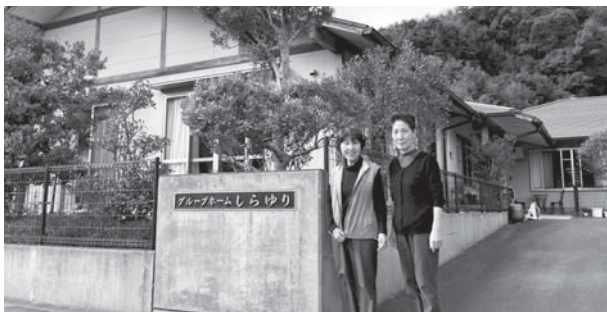
グループホームしらゆり(下田の口)

黒潮町指定地域密着型介護予防サービスの事業の人員、設備及び運営並びに指定地域密着型介護予防サービスに係る介護予防のための効果的な支援の方法に関する基準等を定める条例の一部を改正する条例 厚生労働省が定める介護サービス等の基準については、3年に一度の改正が行われており、平成27年度の介護サービス事業の人員や支援内容などの関係省令の改正に合わせ、条例改正を行うもの。