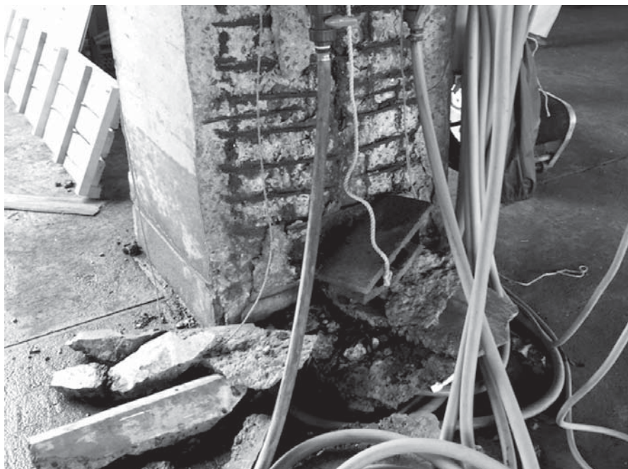
老朽化した漁業施設の一例（入野漁港）

また、改良住宅も古くて倒壊の可能性がある。しかし、津波浸水の可能性がある現地での建て替えには疑問があり、浸水区域外への建て替えを目指している。