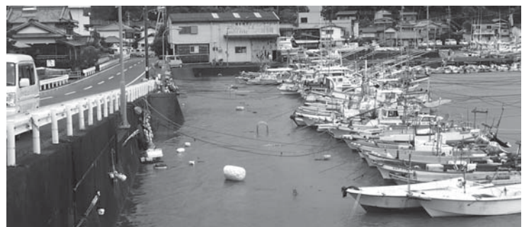
台風時には漁民の不安が常にある。解決策は