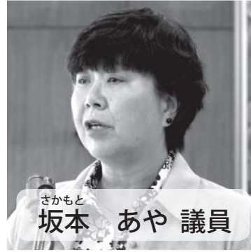
さかもと 坂本 あや 議員