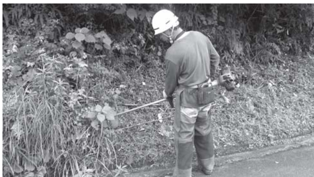
只今、町道の草刈りや、小規模崩土の取り除き作業中です！

なお、まだ大型事業が相当控えており、山間地域のみならず、まだまだ地域で要望を持ち、かつ数年間待っている地域もある。できるだけ不公平感がないように整備に努めていきたい。