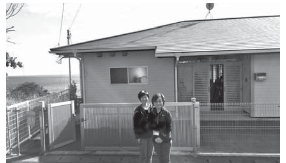
グループホーム和夏(佐賀:かしま荘隣り)