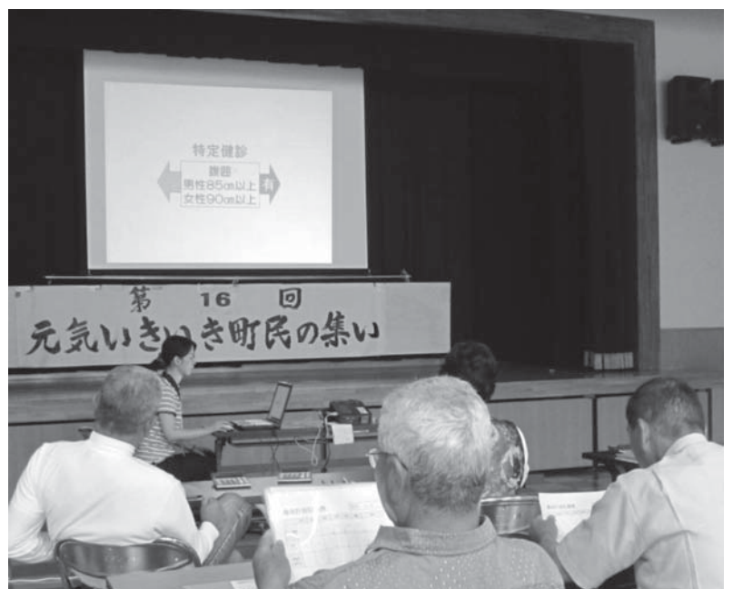
「元気いきいき町民の集い」(保健指導)の一コマ

町への観光入り込み客数は、平成21年以降毎年増加しており、それに伴い経済効果も増加していると推測される。今後はイベントを増やす