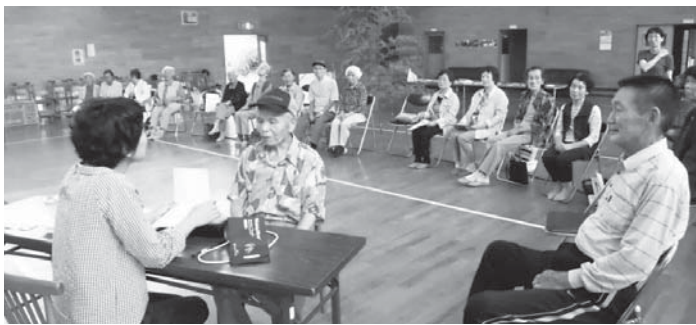
定期的に開催されている「健康相談」(奥湊川にて)

げ充用するものです。単年度で7560万円の赤字です。主な理由は、高額医療の件数が平成25年度より1・5倍増え、医療費も約1億円増加したことです。主に、慢性じん不全や糖尿病、高血圧症などの生活習慣病が増えています。 病気の早期発見や医療費を少なくするためにも特定検診の受診率の向上が必要です。