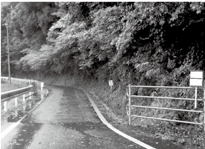
町道に垂れ下がった樹木（荷稻拳ノ川線）

である。避難場所のテレビ等は把握していないので調査整理する。情報伝達の一つとしてNITによって10カ所の避難所に公衆電話の開設をする。ラジオの難聴対策は県補助が来年度計画されており、町内の電波状況調査を行い、告知端末活用や局の開設など予算を伴うので内部で検討を行う。