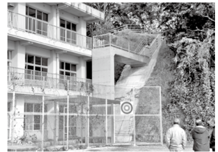
伊田小学校側の避難道