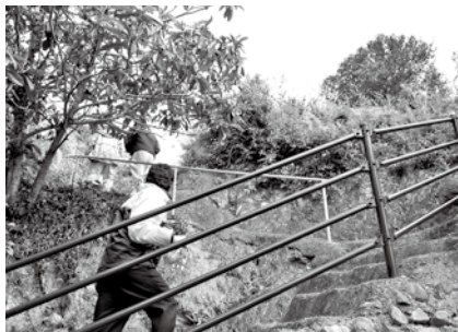
佐賀地区の野田の坂避難道