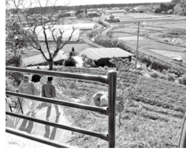
早咲地区の西部避難道