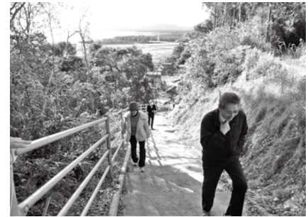
南郷小学校裏山の避難道