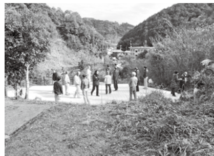
坂折地区の砂防ダム付近 避難場所