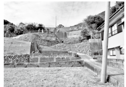
白浜地区の避難道