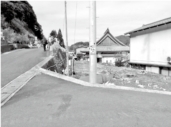
横浜地区避難タワー予定地