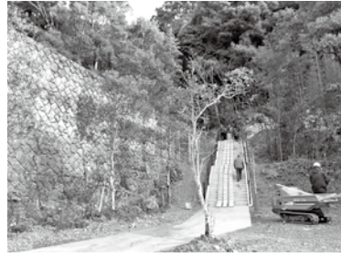
田の口小学校裏山の避難道