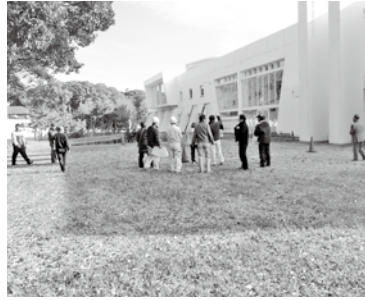
浜の宮地区避難タワー予定地