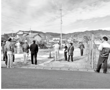
町地区避難タワー予定地