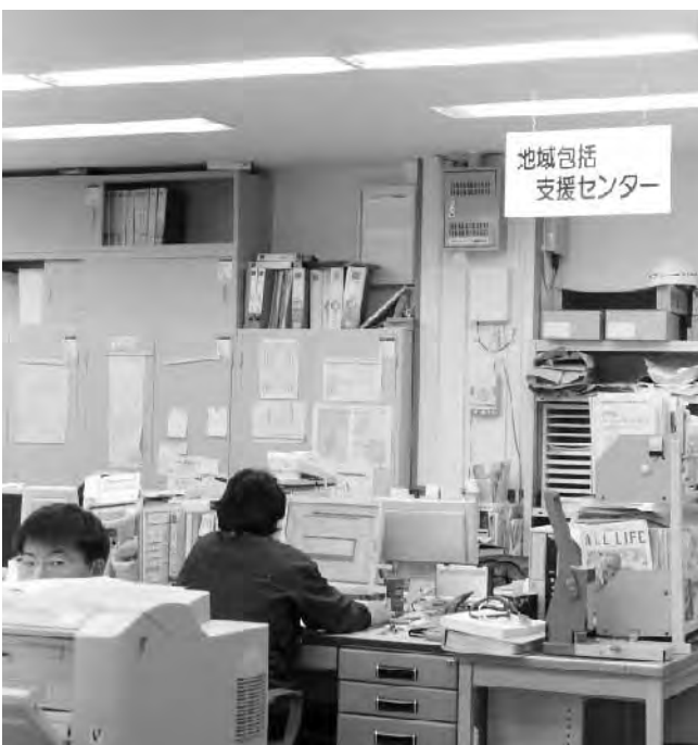
地域包括支援センター

支援組織等は社会福祉協議会、民生・児童委員、健康づくり推進委員、寝たきり予防推進委員、食生活改善推進委員で構成されている。社協の活動には年約2800万円の財政支援をし、各推進委員等には協力に応じた相当の支援はしている。緊急通報装置設置で近所と協力して安否確認もしている。今後は、あったかふれあいセンターの活用と拡充を図る。