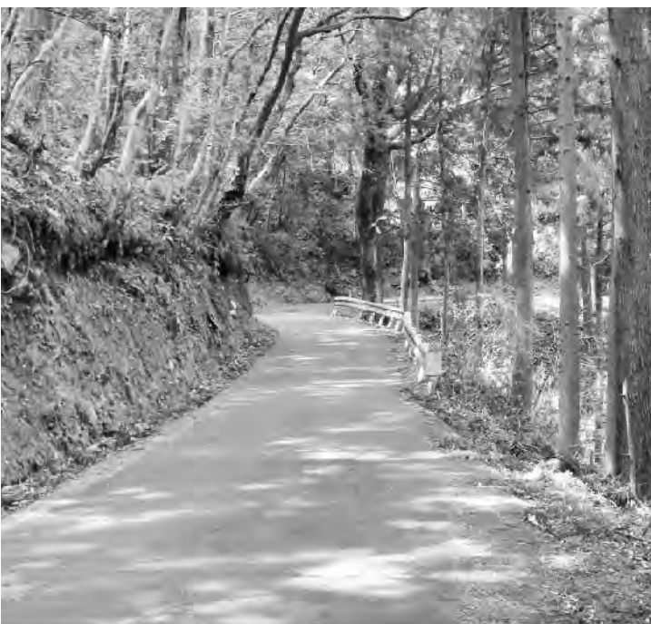
早期完成を待たれる県道秋丸佐賀線

事業の性質を考えれば、全額をこの事業でまかなう必要はないと思うが、出来れば少しづつでも、一般財源からの繰り入れを減らす努力は必要であると考える。 今後の複数年度に渡った収支事業計画を示してほしい。