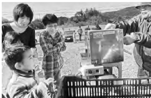
さしすせそフェアでサトウキビの生ジュースをしぼる

候補商品を決め、今後の量産化に向け取り組んでいる。このように徐々にではあるが、「黒潮印」の商品開発計画は、進みつつある。また平成24年度予算でブランド認証する委員会の設置、パッケージやイメージデザインの製作を予定している。