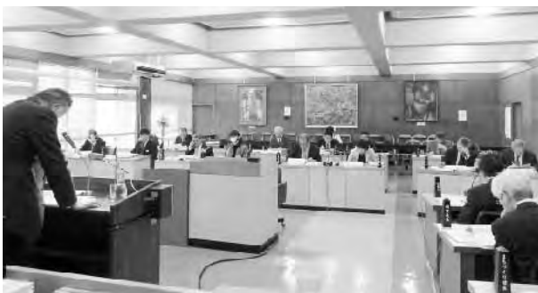
ケーブルテレビでは議会の生中継も

情報関連の各事業は、防災及び行政情報の周知対策、テレビ地デジ化対策、ブロードバンド・ゼロ地域及び携帯電話の不感地地域の解消を目的に一体的に進めており、現状の加入者の分析についても、自主放送開始に向けて対応中の現時点では実施していない。