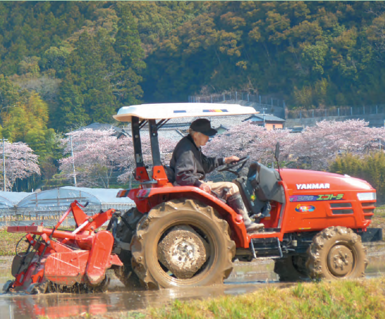
桜満開の田ごしらえ

入野駅前多目的広場整備……………7 新庁舎（スケン谷）用地購入予算決まる……………8 国保税24年度も値上げ……………8