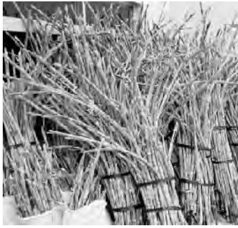
収穫されたサトウキビ

A 委託先は特産品開発推進協議会。試験栽培していた新品種「黒海道」を農家さんにも配って商品開発と販路を拡大する。