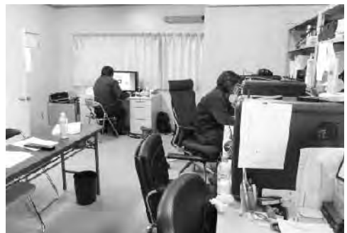
情報センター内の様子

利用料の問題は、町のサービスの一環なので情勢の変化はあろうが値上げは考えていない。