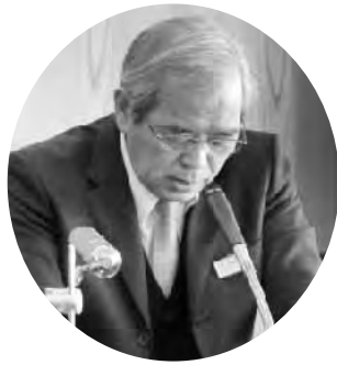
矢野健康福祉課長

A 未収金は19年度6824万円だったものが、平成23年度では6444万円となり5.6%減少した。未収金のある方には督促をしている。