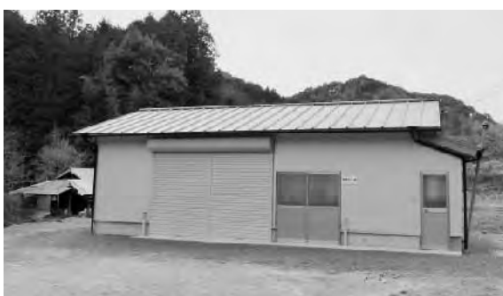
馬荷七立栗生産組合の倉庫が建設された

A 広く町内の団体の方、個人の方に対し予算の範囲内で商品の企画および開発、加工、販路拡大、生産段階から販売段階、観光資源を生かした交流人口の拡大の取り組み等総合的に支援するもの。