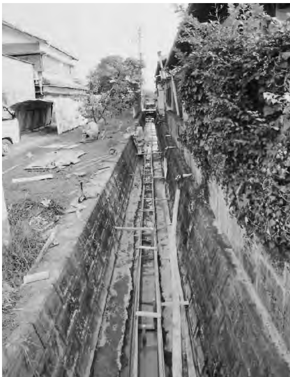
錦団地の部落事業(排水路改修)

個人の大切な財産に関わる事であり、町が実施した地籍調査で発生した新たな問題という事情なので、再度ご説明したい。