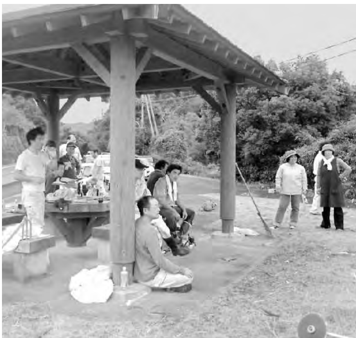
職員の地域活動（田野浦）