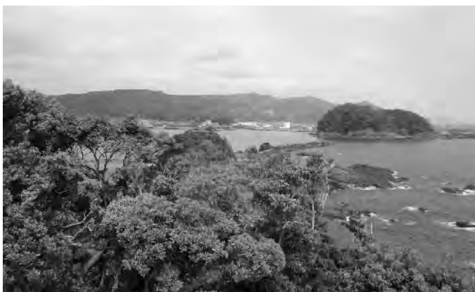
西南大規模公園より佐賀港を望む

問 現在の加入率は。また、県外局（愛媛朝日）の再送信はいつを予定しているか。良い機会であるので再送信を記念して加入促進キャンペーン実施をしないか。