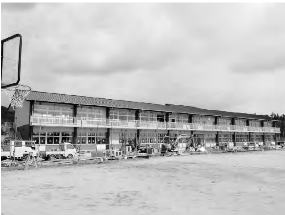
三浦小学校新校舎

耐用年数が過ぎた公営住宅30戸ほどの建て替えの予定があること、加えて20年前から現在に至るまでの人口の推移が右肩下がり減っている状況で、新たに住宅を増やす環境にはないという理由である。