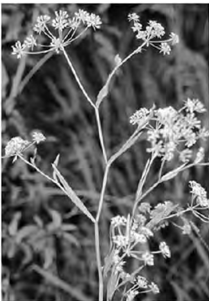
ミシマサイコの黄色の花つぼみ 多くの漢方薬に利用される

サトウキビ生産者も年間を通じて作業があるわけでもないので、一年間のサイクルの中で取り入れていければ、なお良いと思うので、検討していきたい。