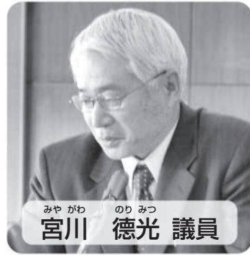
みやがわ のりみつ 議員 宮川 徳光