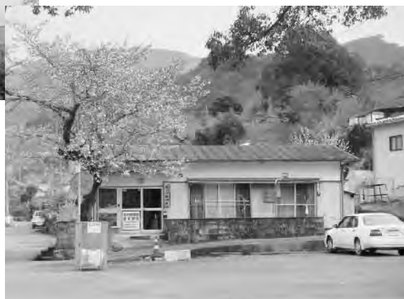
現在の拳の川駐在所