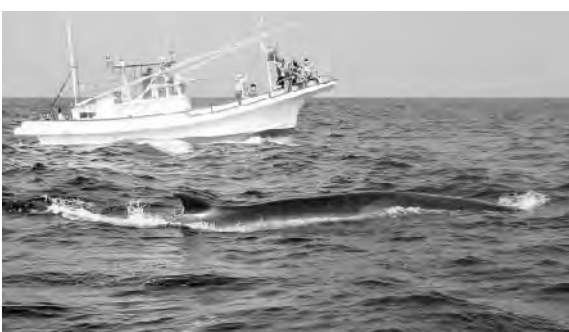
ホエールウォッチング

今後も現在のメニューに加え、スポーツ誘致などにも力を入れ、宿泊客数を伸ばして行きたい。