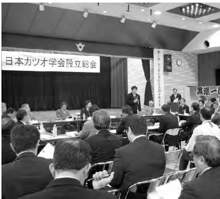
「日本カツオ学会」挨拶に立つ町長